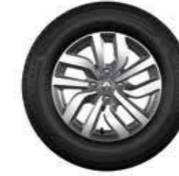
Rin de aluminio Premia 15" diamantado