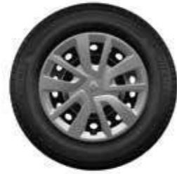
Embellecedor Magiceo 15"