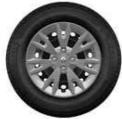
Embellecedor Eptius 15"